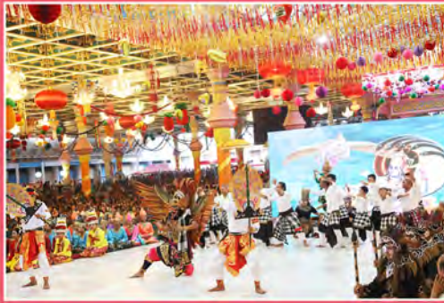
ఇందొనేషియా యువజనుల కార్యక్రమం