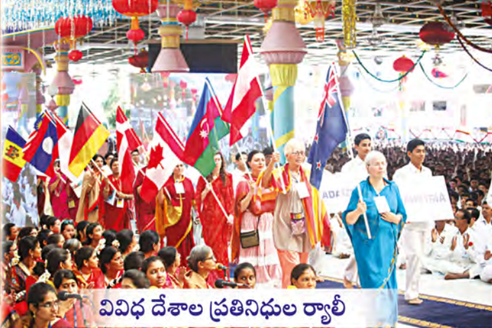
వివిధ దేశాల ప్రతినిధుల ర్యాలీ