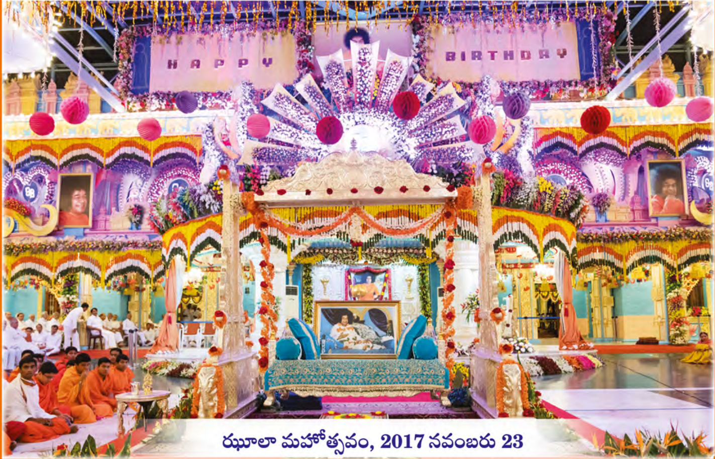
ఝూలా మహోత్సవం, 2017 నవంబరు 23