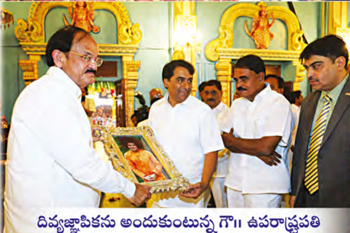
దివ్యజ్ఞాపికను అందుకుంటున్న గౌ॥ ఉపరాష్ట్రపతి