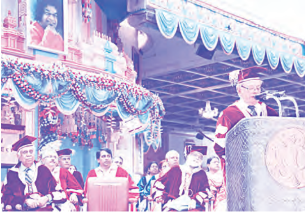
స్నాతకోత్సవంలో ప్రసంగిస్తున్న ముఖ్య అతిథి

నిర్మాణాత్మకమైన భావజాలంతో నూతనత్వానికి వెరువక, సవాళ్ళను ఎదుర్కొంటూ అవకాశాలను అందిపుచ్చుకోండి” అన్నారు.