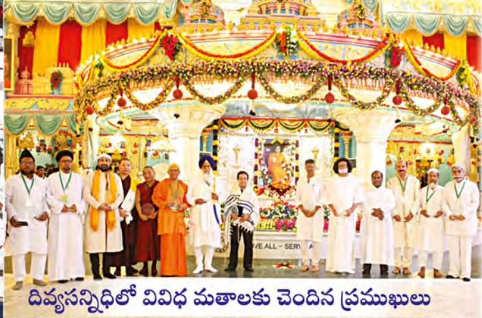
దివ్యసన్నిధిలో వివిధ మతాలకు చెందిన ప్రముఖులు