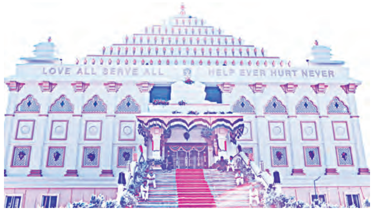
సర్వాంగ సుందరంగా రూపుదిద్దుకున్న ‘శ్రీ సత్యసాయి ఆర్మైవ్’

సనాతనమైన సంస్కృతిగల పరమ పావనమైన భారత దేశంలో పుట్టినందుకు నేనెంతో గర్వపడతాను. ఆది కాలమునుంచి, వేదకాలమునుంచి, పుణ్యకాలమునుంచి, పురాణకాలమునుంచి మన పూర్వీకులు అనుభవించి రంగరించి మేళవించి మనకందించిన జీవనసత్యం ఏదైతే ఉన్నదో ఆ వారసత్వం మనకందరికీ కూడా జవసత్వాల నిస్తుంది. దానిని స్ఫూర్తిగా తీసుకుని మనం ముందుకు సాగాలి. ప్రపంచానికి భారత్ అందించిన గొప్ప కానుక ఆధ్యాత్మికతత్వం. ప్రపంచం భారతదేశాన్ని ఆధ్యాత్మిక రాజధానిగా పరిగణిస్తోంది. మనకా స్థాయి కలిగించిన