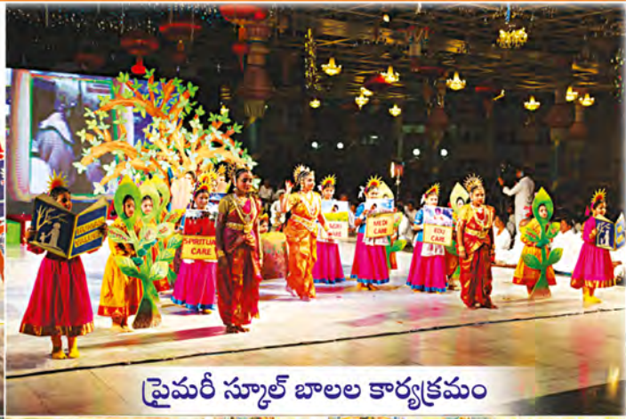
ప్రైమరీ స్కూల్ బాలల కార్యక్రమం