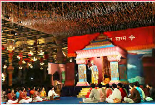
'సంకీర్తన సారం'లోని ఒక దృశ్యం