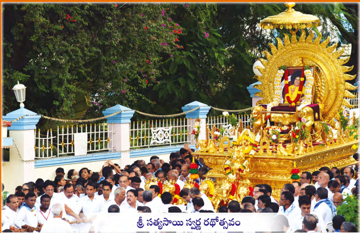
శ్రీ సత్యసాయి స్వర్ణ రథోత్సవం