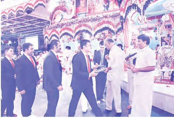
యోగ్యతాపత్రాలను అందుకుంటున్న యువజనులు

అన్నారు. దైవాజ్ఞను శిరసావహిస్తే సర్వమూ మనకు సిద్ధిస్తుందన్నారు.