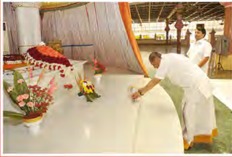
స్వామి సన్నిధిలో తెలుగు రాష్ట్రాల గవర్నర్ (మార్చి 23)