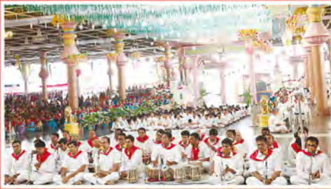
హైదరాబాద్ పర్తియాత్ర - సంగీత విభావరి