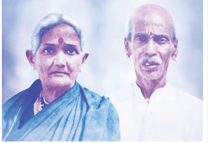
అవతారపురుషుని జననీ జనకులు

మరునాడు ఈశ్వరమ్మ నావద్దకు వచ్చి, “నిన్నటి దినము కార్యక్రమం చాలా బాగా జరిగింది. ఐతే, నాకు మరొక కోరిక ఉన్నది. మన పల్లెప్రజలు సరియైన వైద్యసౌకర్యం లేక బాధపడుతున్నారు. కనుక, ఒక చిన్న ఆసుపత్రి కట్టించండి” అన్నది. సరే, కట్టించాను. ఆసుపత్రి ప్రారంభోత్సవానికి బెజవాడ గోపాలరెడ్డిని పిలిపించాము. ప్రారంభోత్సవం చాలా ఘనంగా జరిగింది. ఇంత గొప్పగా జరుగుతుందని ఈశ్వరమ్మ అనుకోలేదు. మరునాడు నావద్దకు వచ్చింది. “స్వామీ! ప్రజల బాధలు తగ్గించి నా మనోభీష్టమును నెరవేర్చారు. ఇంక నేను మరణించినా ఫరవాలేదు” అన్నది. “ఇంకా ఏమైనా కోరికలుంటే అడుగు” అన్నాను. “స్వామీ! ఇంకొక్క చిన్న కోరిక ఉన్నది. మన చిత్రావతి వర్షాలు వచ్చినప్పుడు పొంగిపోతుందిగాని, లేనప్పుడు కనీసం త్రాగటానికైనా నీరుండదు. కాబట్టి, ఒక బావిని తవ్వించండి” అన్నది. “అవుతుంది, అవుతుంది, యోచన పెట్టుకోకు” అన్నాను. ఈ రోజుల్లో నీరు కావాలంటే బోర్లు వేస్తున్నారు. కానీ బోర్లు వేస్తే ప్రయోజనం ఉండదు. కొంతకాలం నీరు వస్తుంది. తరువాత అందులో నీరు ఒక్కచుక్కైనా ఉండదు. కాబట్టి నాకు బోర్లు వేయటం ఇష్టం ఉండదు. పాత మందిరంలోనే ఒక బావి తవ్వించాను. మంచి మనస్సుతో ఏది సంకల్పించినా అది ఫలిస్తుంది. ఏడడుగులుకూడా తవ్వలేదు, పెద్ద నీటిబుగ్గ పడింది. గ్రామప్రజలందరూ వచ్చి నీరు తీసుకువెళ్లటానికి వీలుగా మందిరం వెనుక తలుపు పెట్టించాను. మీకు తెలుసు - క్రమక్రమేణా అనంతపురంజిల్లా అంతటికి తుంగభద్రనుండి నీరు తెప్పించి యిచ్చాను. చిన్న విత్తనమే పెద్దవృక్షముగా మారిపోయినట్లు ఆనాడు కట్టించిన చిన్న స్కూలే ఈనాడు పెద్ద యూనివర్సిటీగా మారిపోయింది. ఆనాడు కట్టించిన చిన్న ఆసుపత్రియే