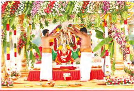
సాయికుల్యంట్ హాల్లో శ్రీ సీతారామ కల్యాణం