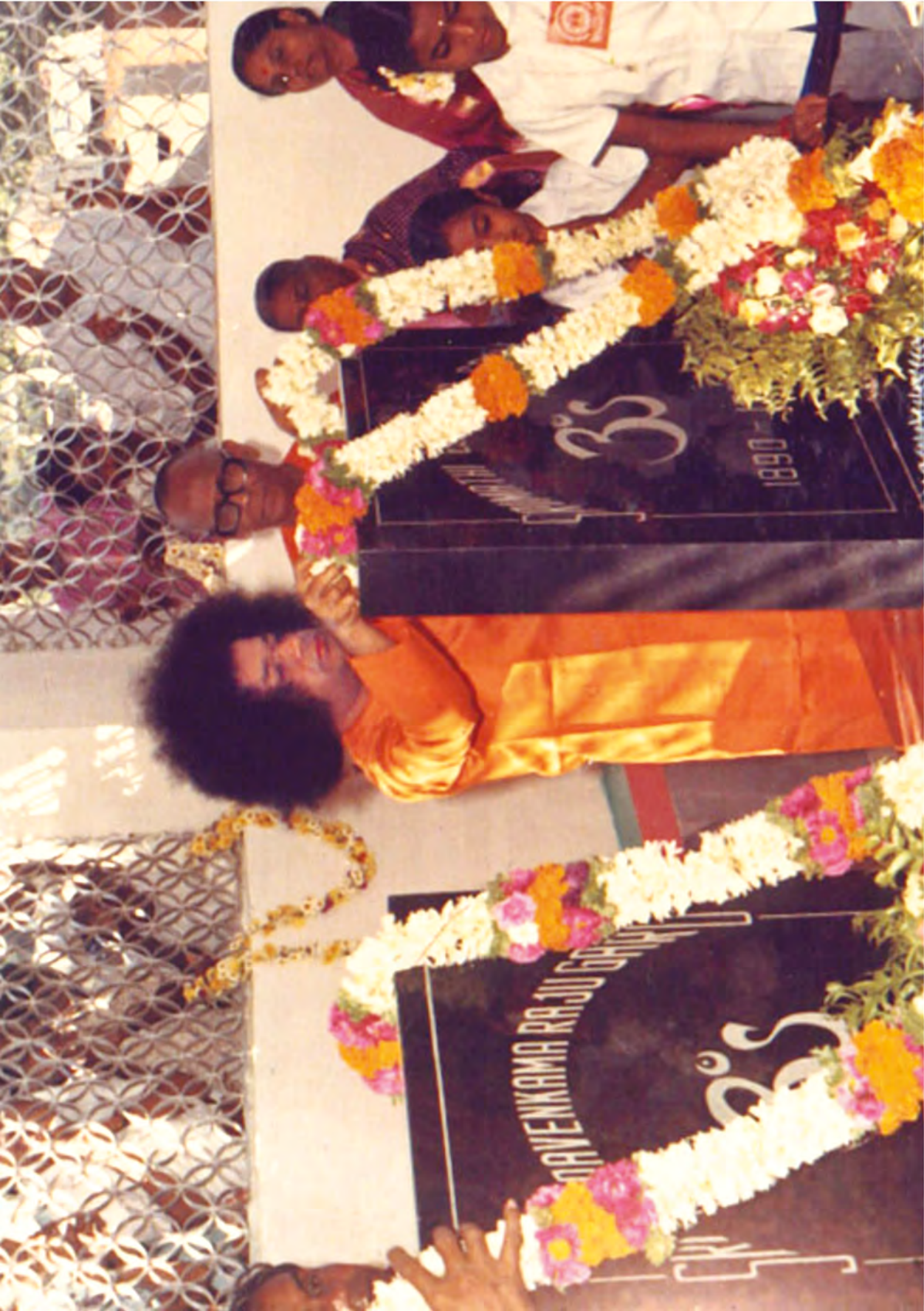
“భగవాన్ జీవితమే జగత్తికి సందేశం” - జననీ జనకుల సమాధి మందిరంలో సాయాశ్చరులు