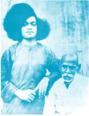
స్వామి సన్నిధిలో కొండమరాజుగారు