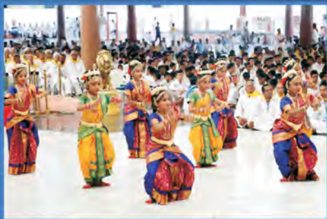
విజయనగరం జిల్లా బాలల నృత్య ప్రదర్శన