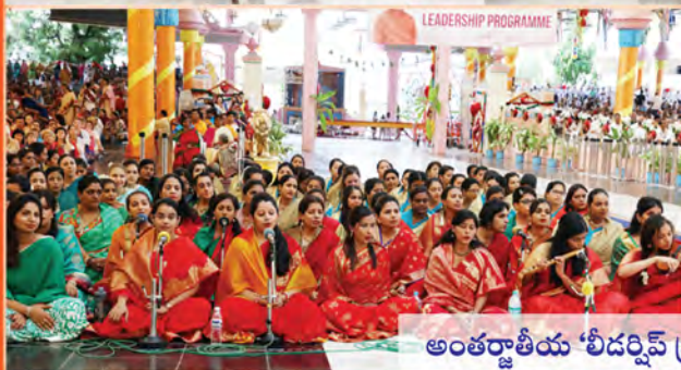
అంతర్జాతీయ ‘లీడర్షిప్ ప్రోగ్రామ్’ స్నాతకోత్సవం