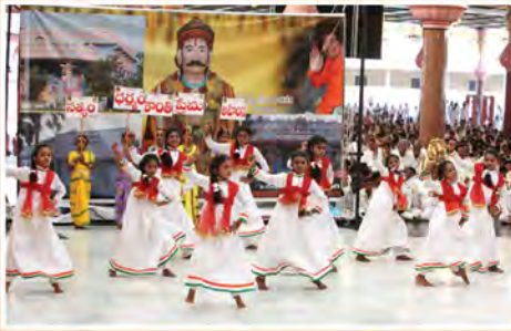
ఖమ్మం జిల్లా బాలల నృత్య సంగీత రూపకం