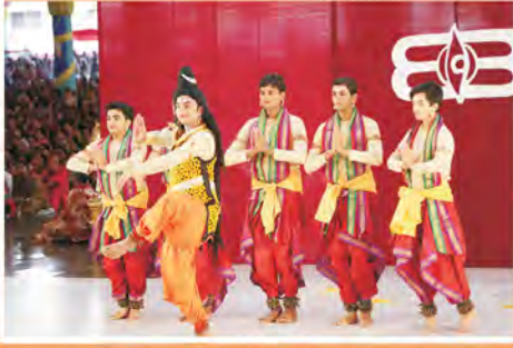
ప్రశాంతి డ్యాన్స్ గ్రూపు 'శివస్తుతి'