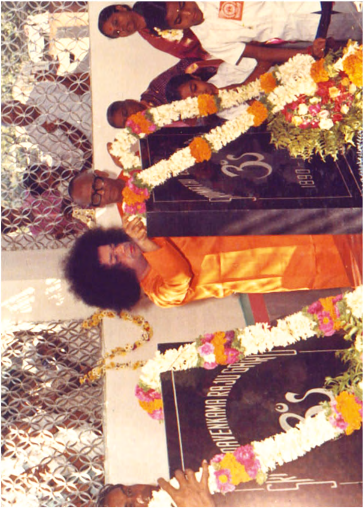
“భగవాన్ జీవితమే జగతికి సందేశం” - జననీ జనకుల సమాధి మందిరంలో సాయాశ్వరులు