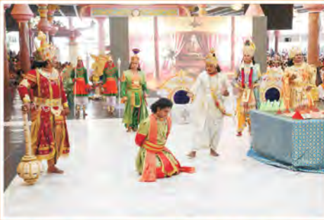
అదిలాబాద్ జిల్లా పర్షియాత్ర: "ప్రేమసారం" నాటిక