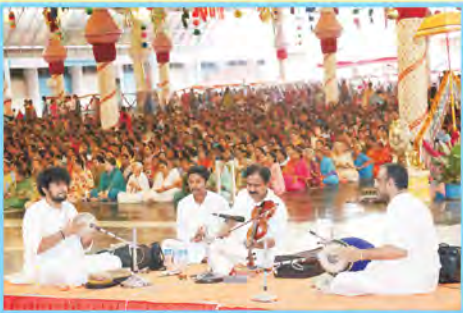
లాల్ గుడి కృష్ణన్ వయోలిన్ వాద్యకచేరి