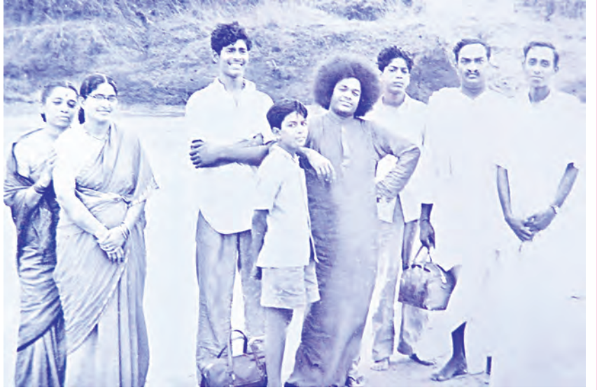
రచయిత బాల్యంలో... స్వామి సన్నిధిలో (1958 నాటి ఛాయాచిత్రం)

దాదాపు పది అంగుళాల పొడవు, ఎనిమిదంగుళాల వెడల్పు, ఒకటిన్నర అంగుళాల మందం ఉన్న ఒక దీర్ఘ చతురస్రాకారపు రాయి అది. స్వామి తమ చేతిలో ఉన్న టవల్‌ని క్రిందపరచి, దానిమీద పెట్టమన్నారు. టవల్‌తో పూర్తిగా దానిని కవర్ చేసి, రెండుసార్లు దానిమీద తట్టి, “ఊఁ... అందరికీ పంచిపెట్టు” అన్నారు. టవల్ తీసి చూస్తే, అక్కడ రాయి లేదు, అచ్చం అదే ఆకృతిలో పటిక బెల్లం ఉంది!!