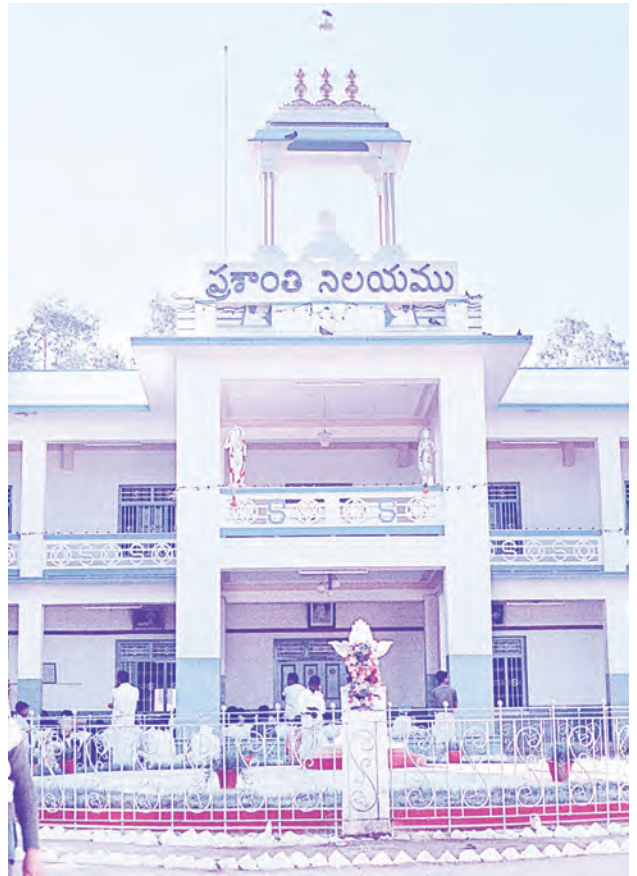
మందిరం మధ్యభాగం (1955 ప్రాంతంలో)

ఇప్పుడు మందిరంలో కుడివైపున్న ‘ఇంటర్వ్యూ రూమ్’ని ‘కోరికల గది’ అని స్వామి వ్యవహరించేవారు.