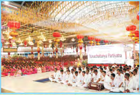
‘యువచైతన్య పర్తియాత్ర’ సంగీత విభావరి