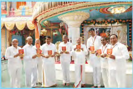
‘సాయి యువత కార్యాచరణ ప్రణాళిక’ పుస్తకావిష్కరణ